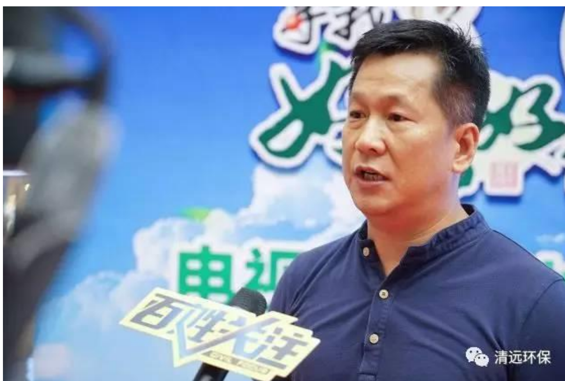
市环境保护局局长林丹雄同志接受媒体采访

7月3日下午，由清远市创建国家环境保护模范城市工作领导小组办公室、清远市环境保护局、清远市住房和城乡建设管理局联合举办的《寻找清远好山好水》电视栏目开拍暨2017清远绿色社区大型评选活动启动仪式在顺盈时代广场举行。